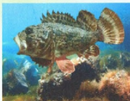
СКОРПЕНА, МОРСКОЙ ЕРШ