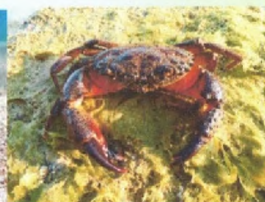
БОЛЬШОЙ КАМЕННЫЙ КРАБ