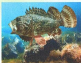
СКОРПЕНА, МОРСКОЙ ЕРШ