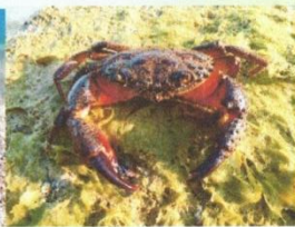
БОЛЬШОЙ КАМЕННЫЙ КРАБ